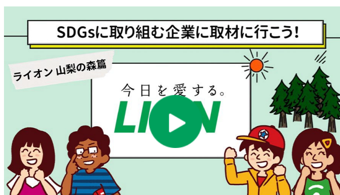
SDGsに取り組む企業に取材に行こう！2023 「ライオン 山梨の森篇」

さらに子どもたちが、実際に社会課題解決に取り組む企業の事例を見る事で、SDGsをより身近なものとして捉え、これからの進路を考える上でのヒントにしてもらうことを目的に「SDGsに取り組む企業に取材に行こう！」と題した動画を公開しています。以下のとおり、ライオンのSDGsに関する取組みが紹介されています。