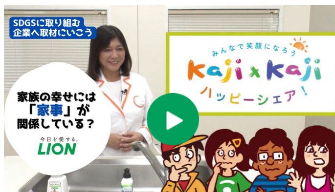
SDGsに取り組む企業へ取材に行こう！ライオン 2022篇 「家事シェアを通じたジェンダー平等実現の取り組みについて」