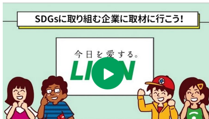
SDGsに取り組む企業へ取材に行こう！ライオン編 「プラスチック削減の取り組みと手洗い習慣の大切さについて」