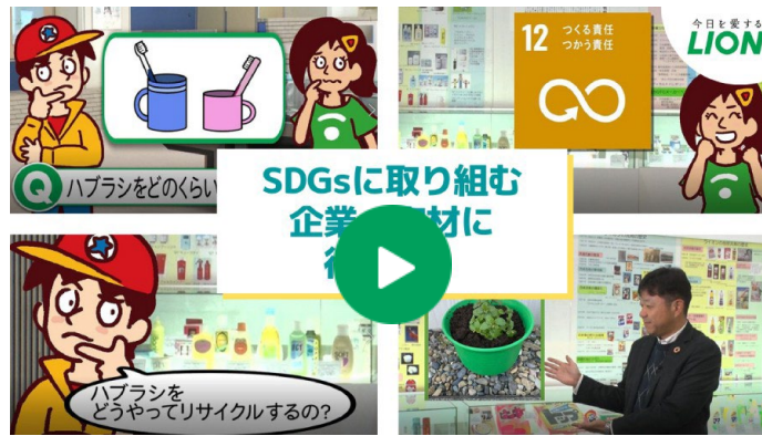
SDGsに取り組む企業へ取材に行こう！ライオン編 「お口の健康から健やかな未来をつくる取り組みについて」