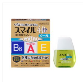
スマイル40EX ゴールドクール