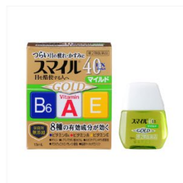
スマイル40EX ゴールドマイルド