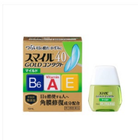
スマイル40 ゴールドコンタクト マイルド