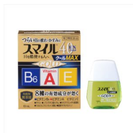
スマイル40EX ゴールドクール MAX