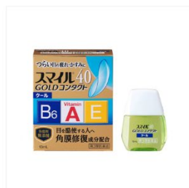
スマイル40 ゴールドコンタクト クール